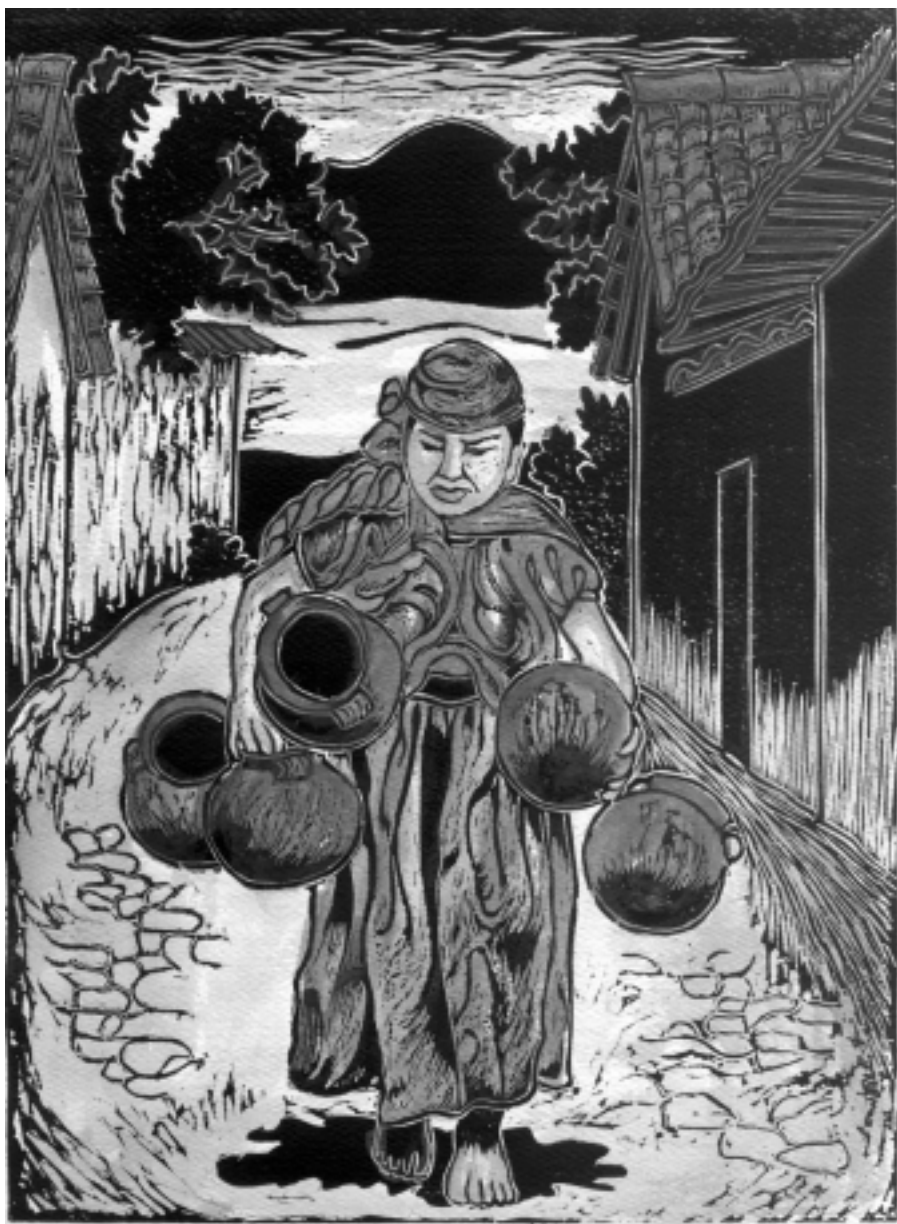
Alfarera de Ichan