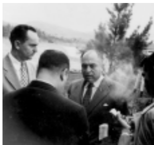
Entrevistado por periodistas.