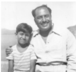
Con uno de sus hijos.