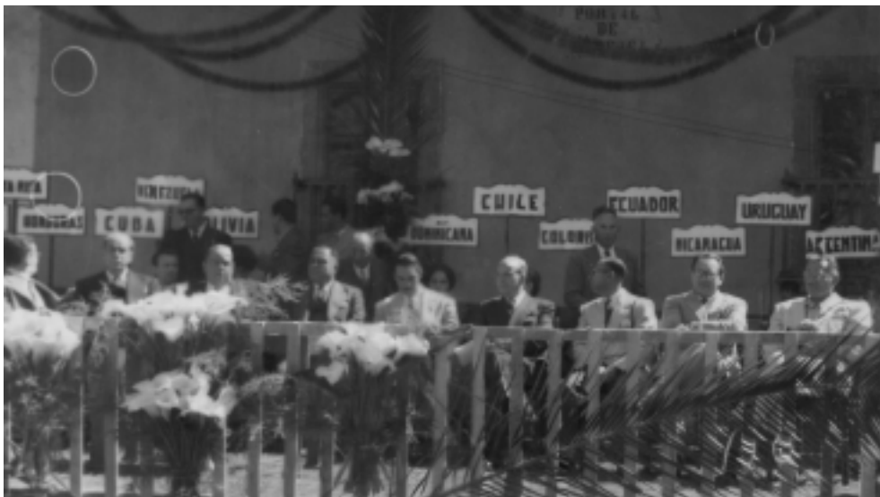
En el presidium en una ceremonia de bienvenida a alumnos del CREFAL, provenientes de diversos países.