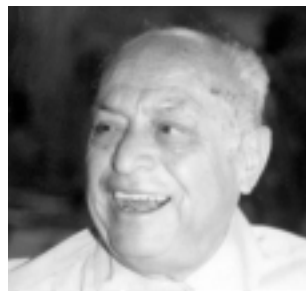
Sus últimos días.