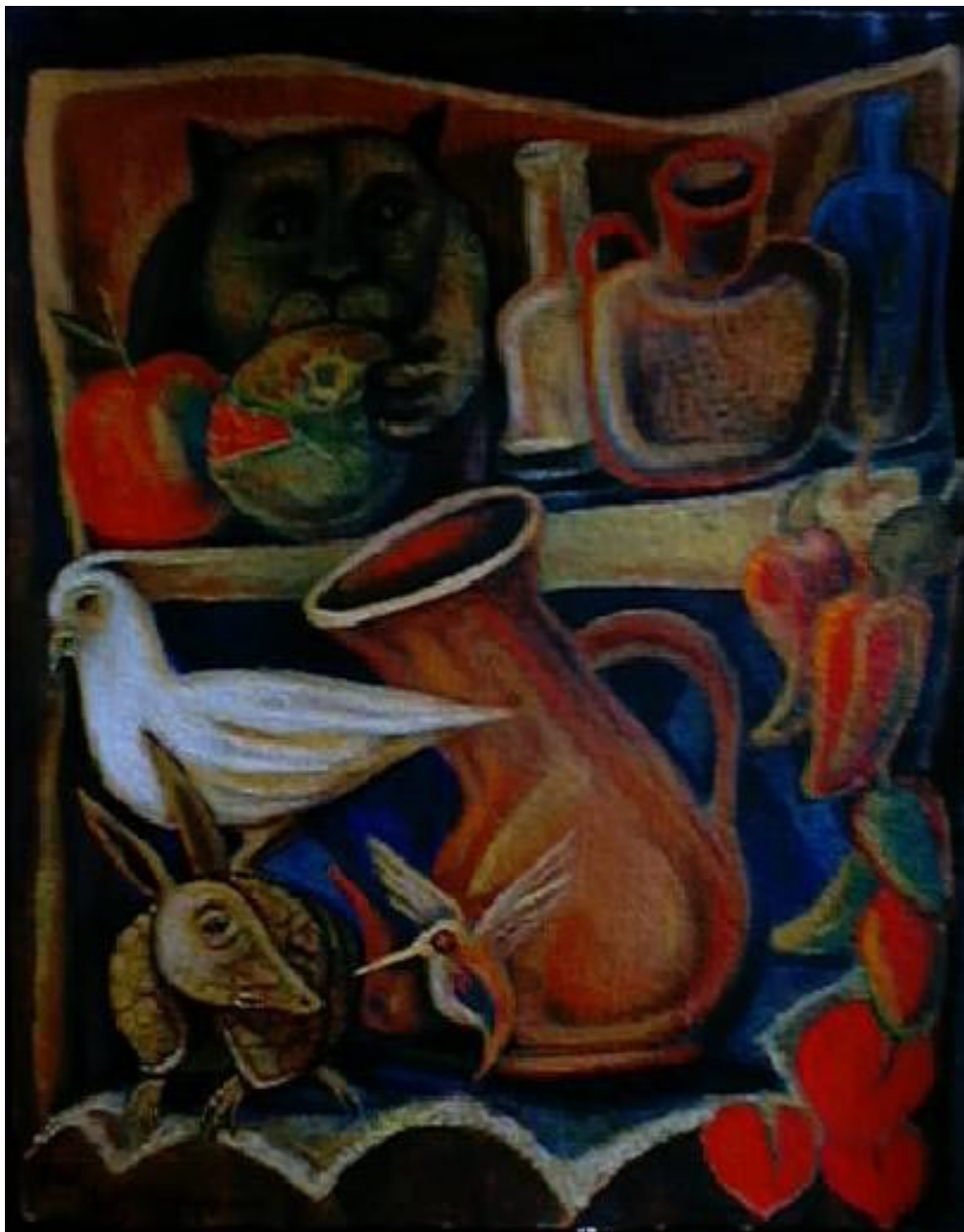
Alacena con gato. Acrílico sobre papel reciclado 59 x 48 cm.