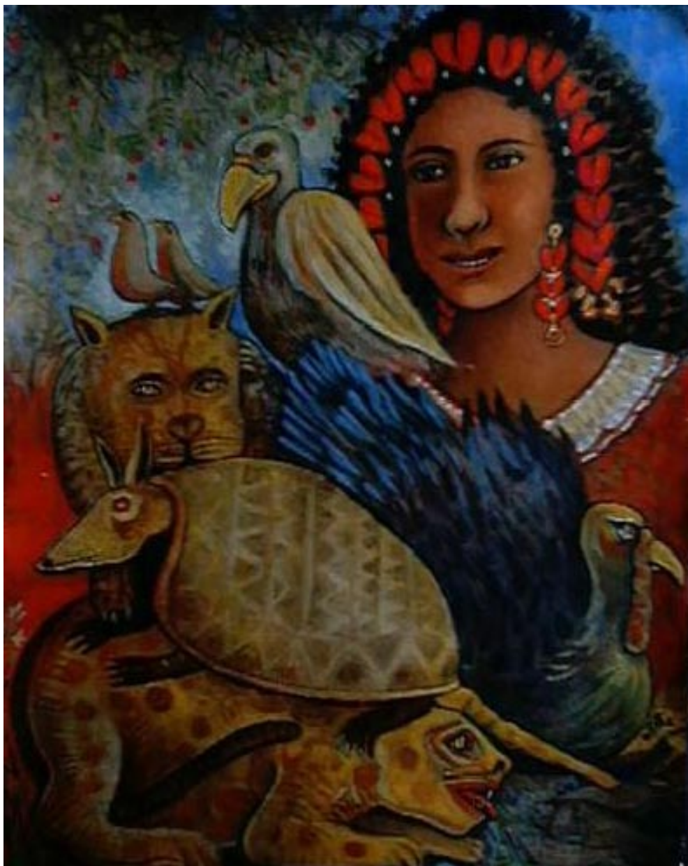
Arco de corazones. Acrílico sobre papel reciclado 59 x 48 cm.