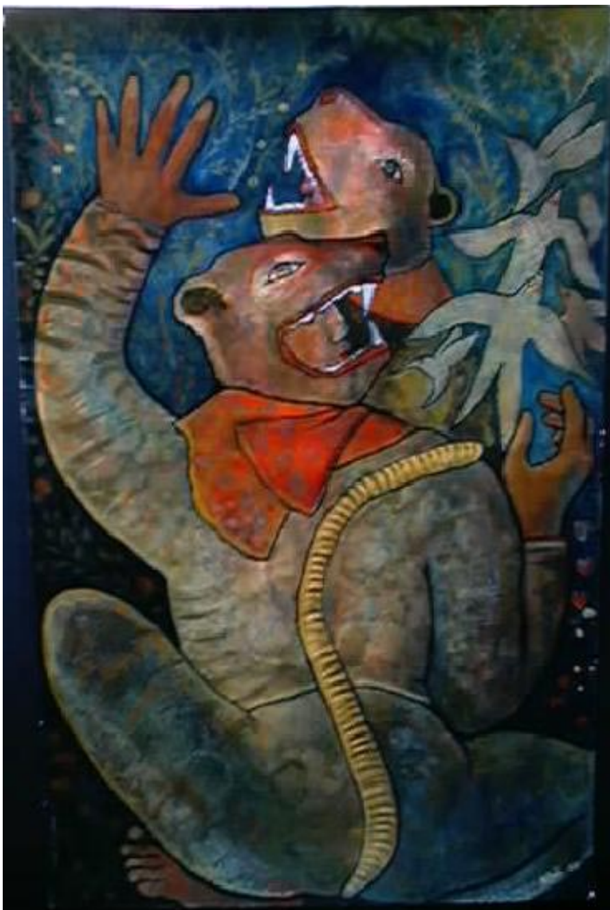
Los cazadores. Acrílico sobre pape reciclado 98 x 60 cm.