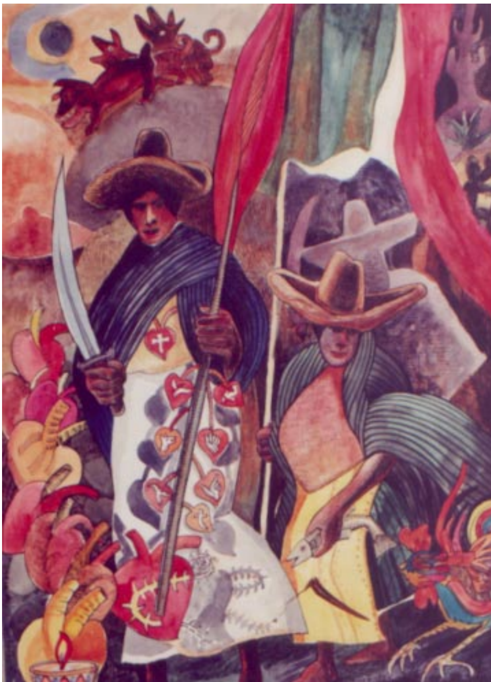
Danza de los machetes. Acrílico sobre papel fabirano 70 x 50 cm.