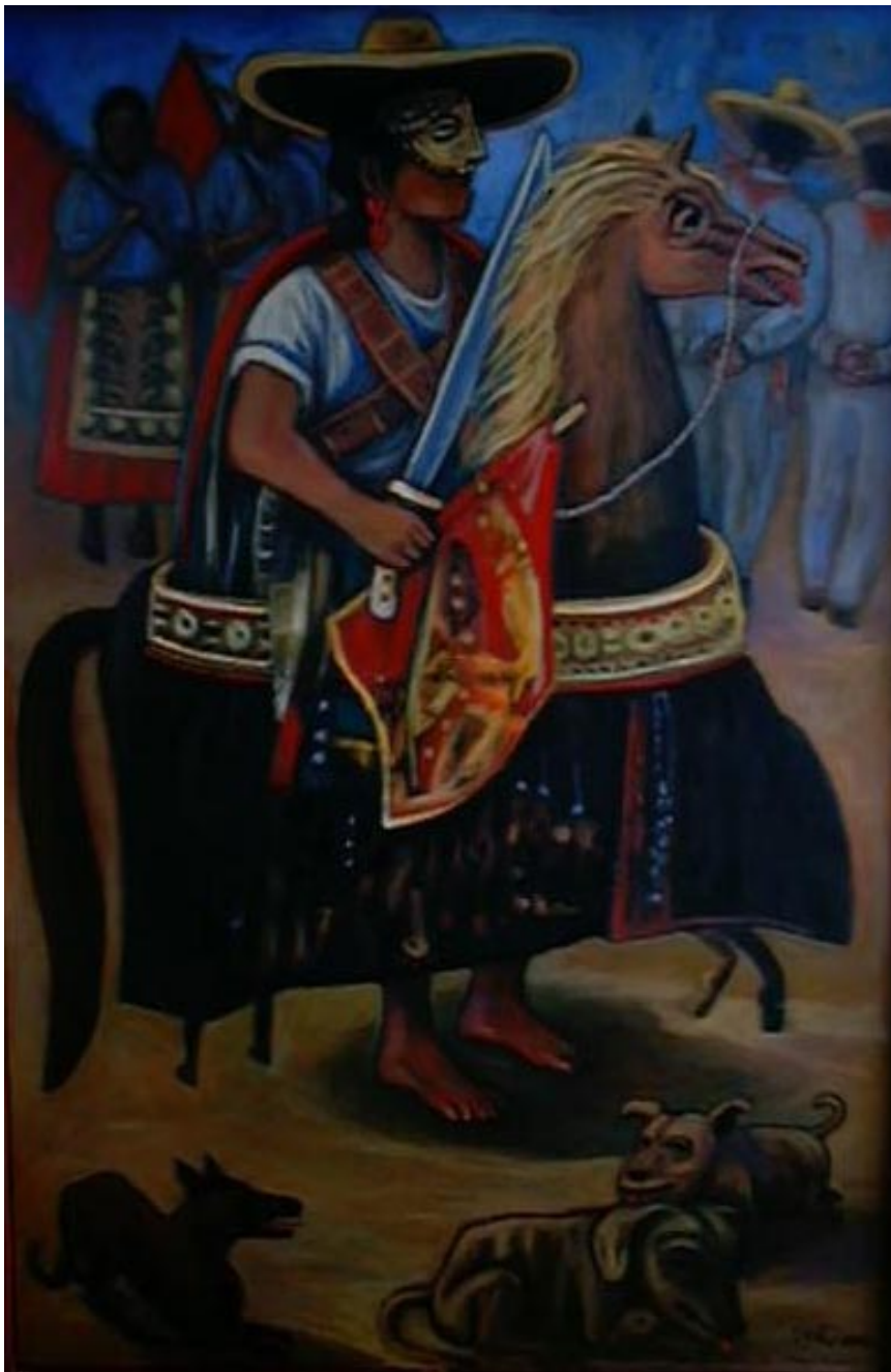
La Chanantzcuá. Acrílico sobre tela 90 x 60 cm.