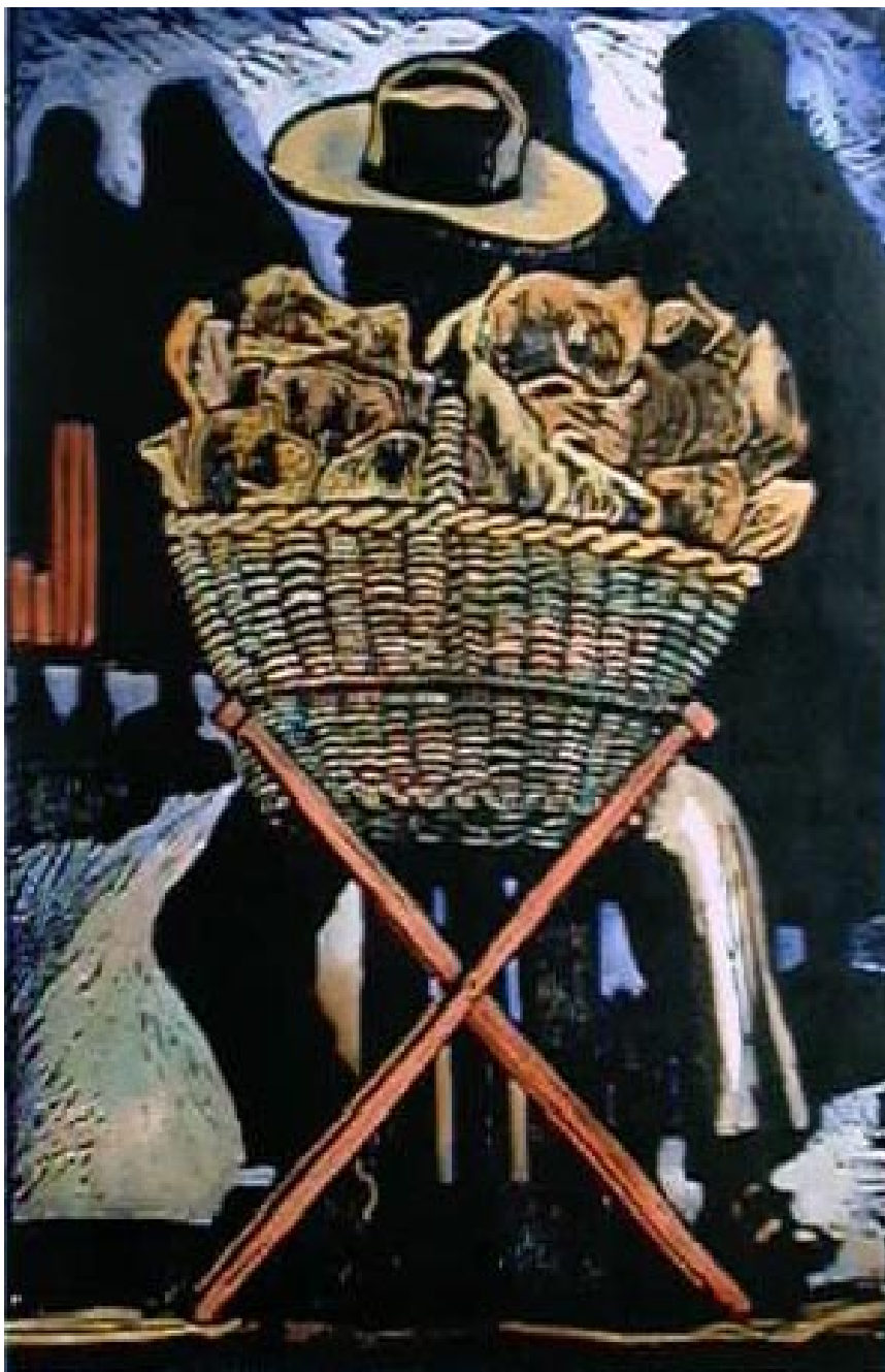
Chicharronero . Xilografía acquareleada 70 x 40 cm.