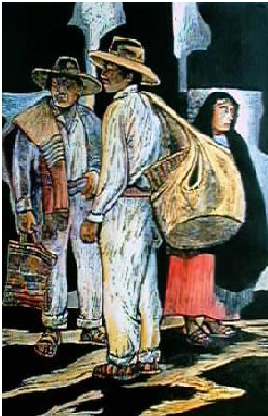
Mercado de Pátzcuaro. Xilografía acquareleada 70 x 40 cm.