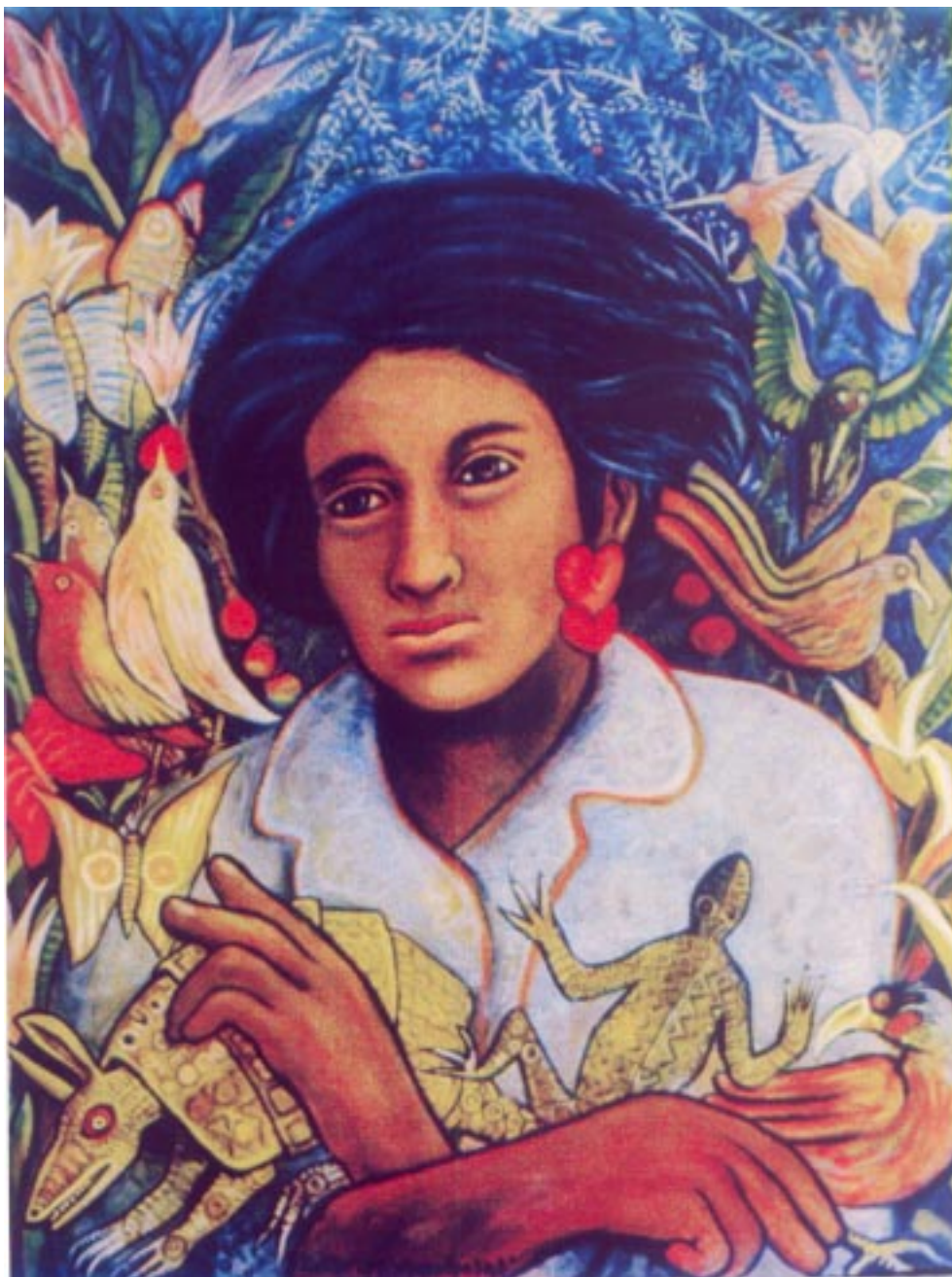
Muchacha con fauna. Acrílico sobre papel reciclado 59 x 48 cm.