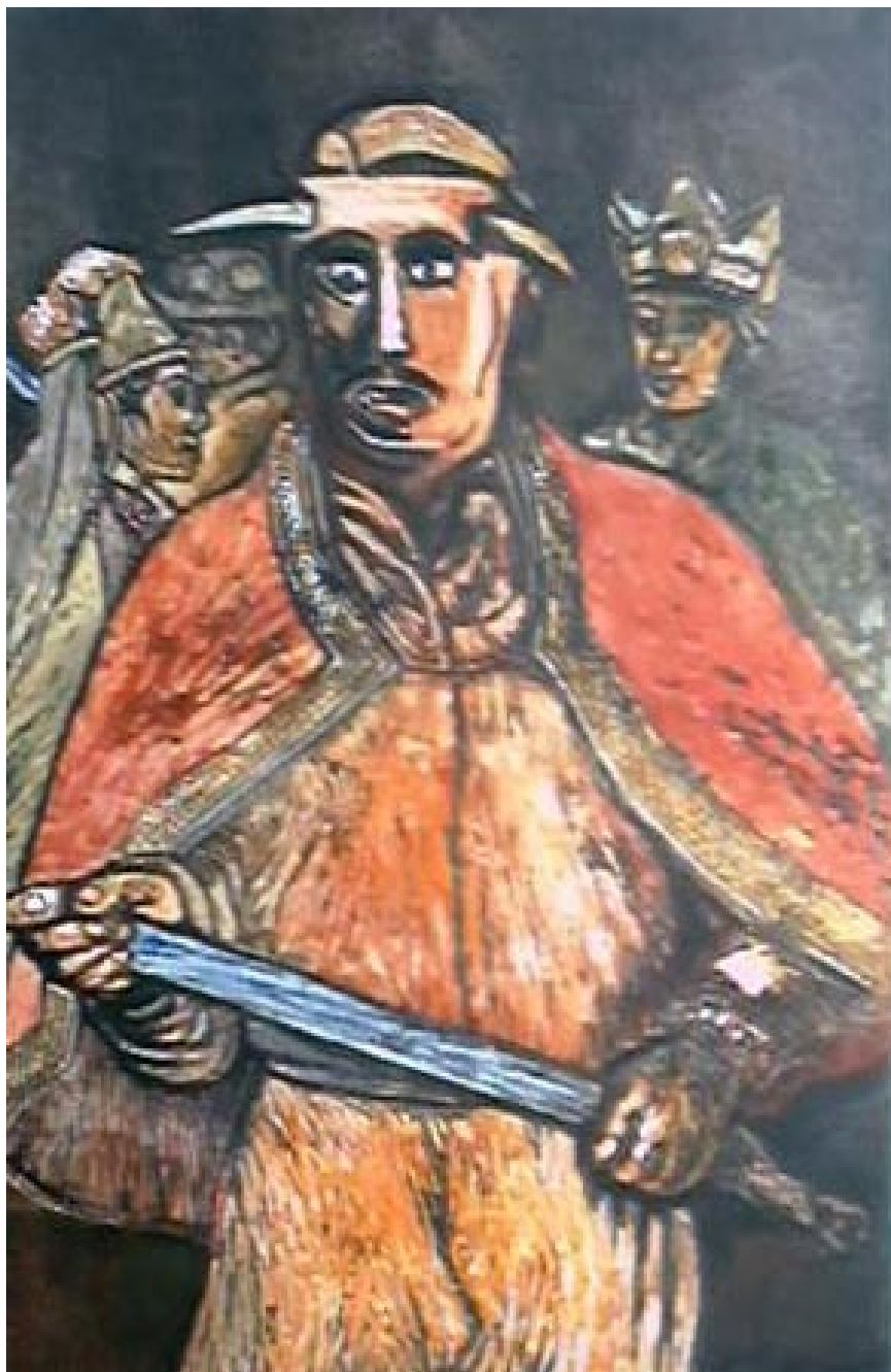
Danzante lucifer. Xilomixtura 70 x 40 cm.