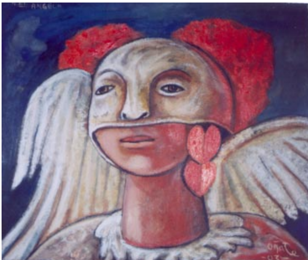
El ángel. Acrílico sobre papel reciclado 29 x 34 cm.