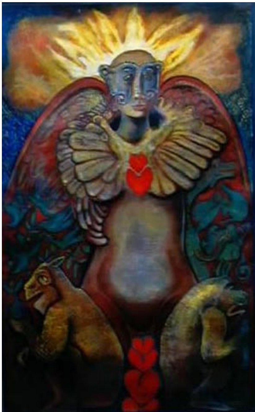
En el paraíso. Acrílico sobre papel reciclado 98 x 60 cm.