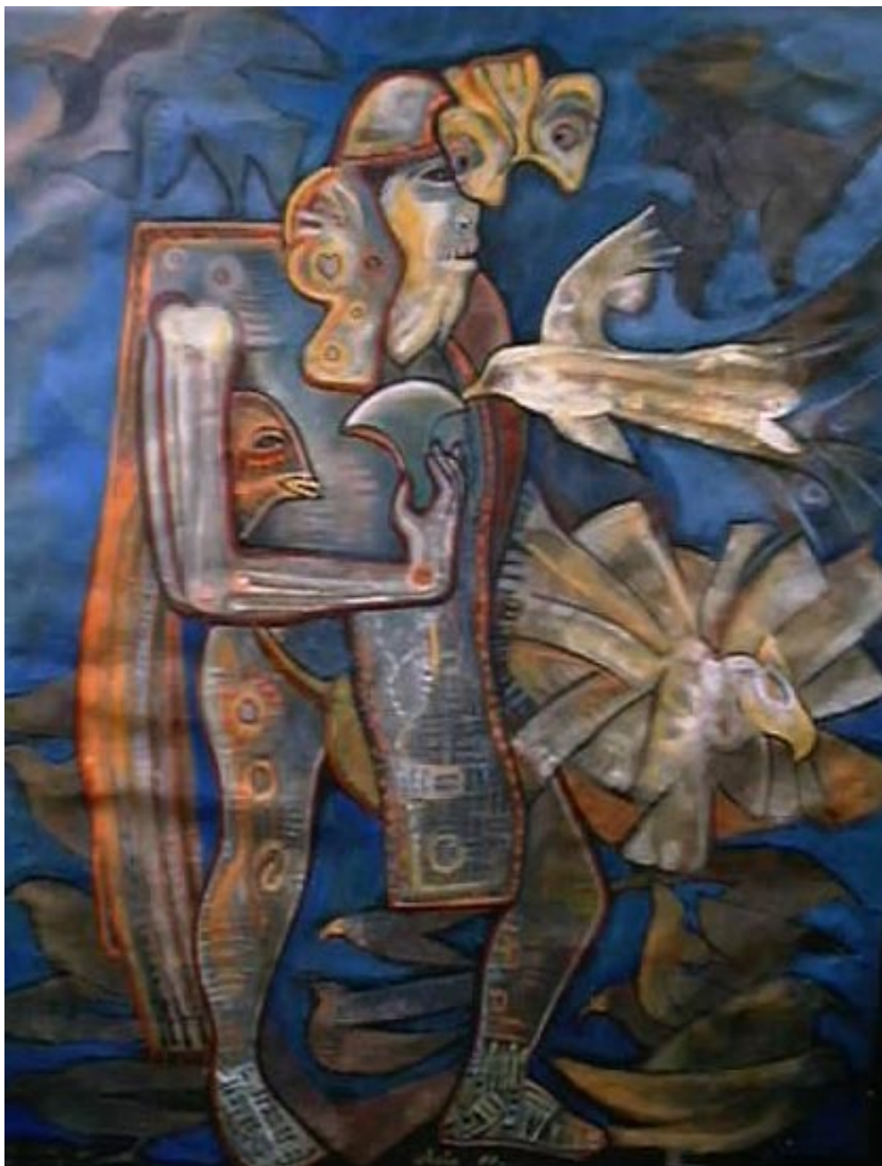
Señor de las aves . acrílico sobre papel reciclado 80 x 60 cm.