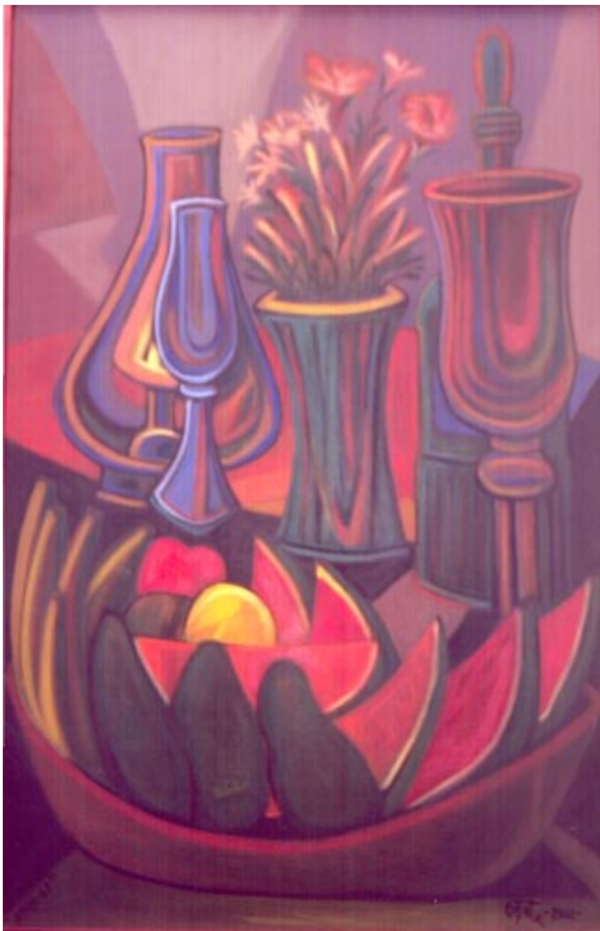
Sandías . Acrílico sobre tela 90 x 60 cm.