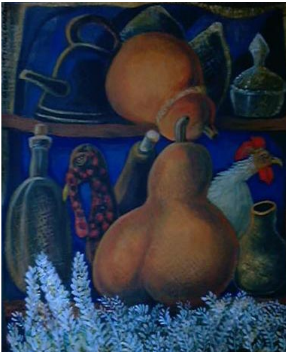
Alacena con flores blancas. Acrílico sobre papel reciclado 59 x 48 cm.