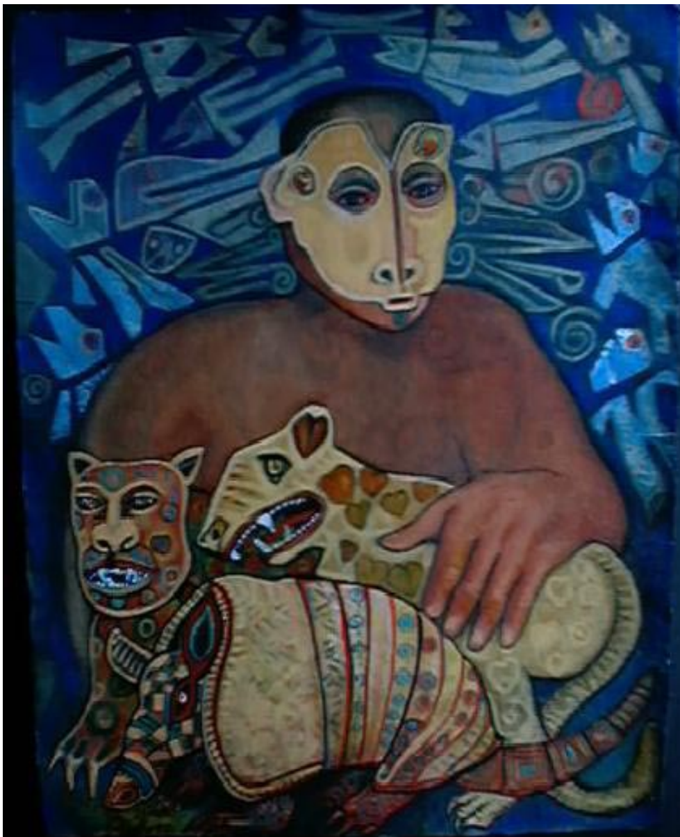
El Señor. Acrílico sobre papel reciclado 59 x 48 cm.