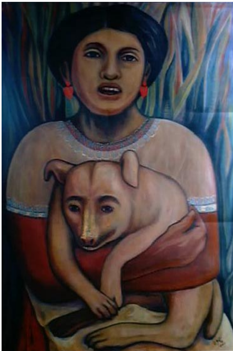
Florita y su ladrón. Acrílico sobre papel reciclado 98 x 60 cm.