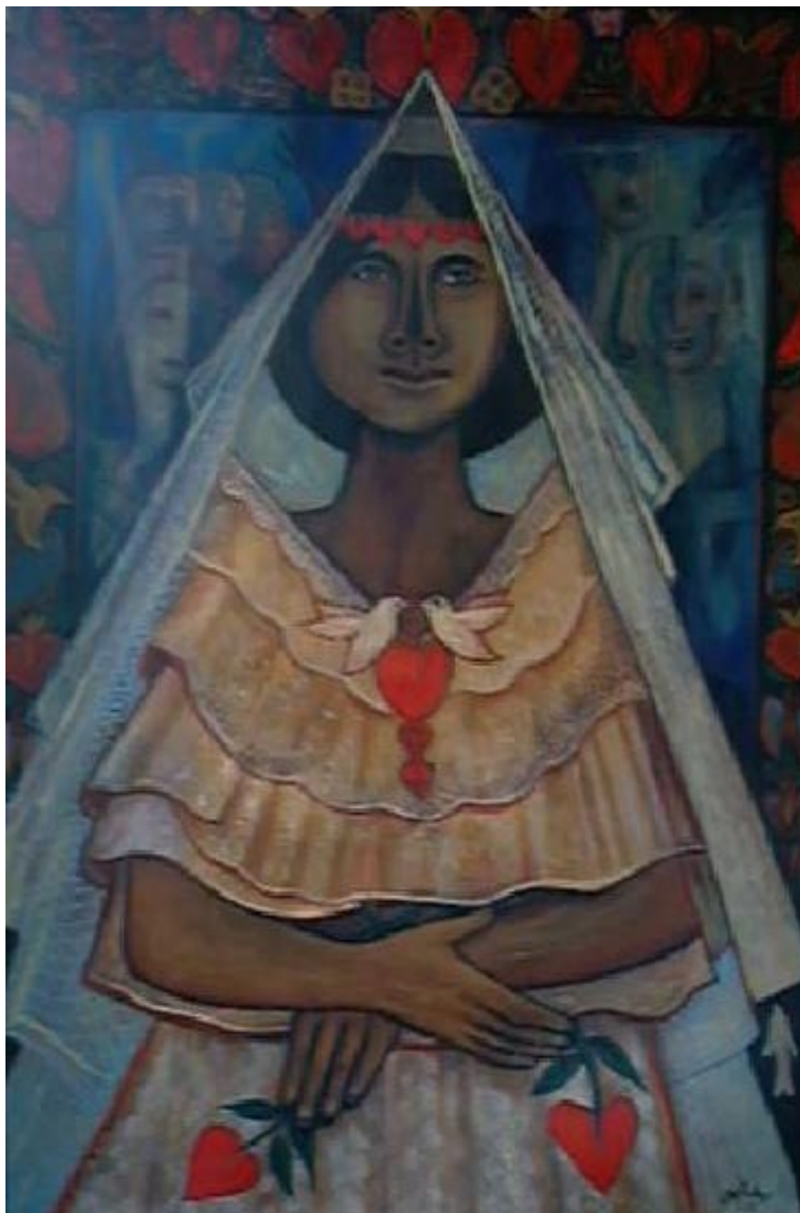
Atisbando la novia. Acrílico sobre papel reciclado 98 x 60 cm.