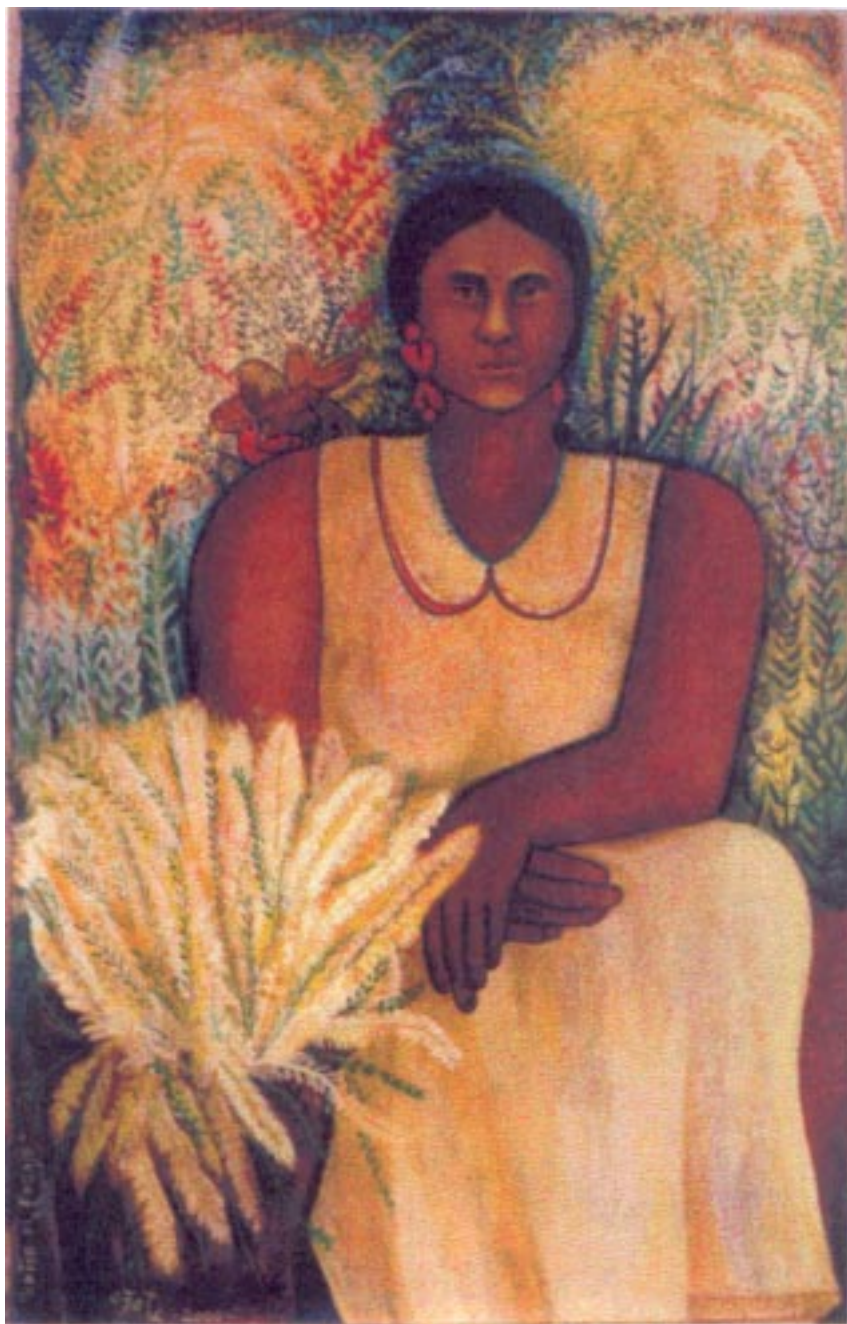
Entre follaje. Acrílico sobre papel reciclado 98 x 60 cm.