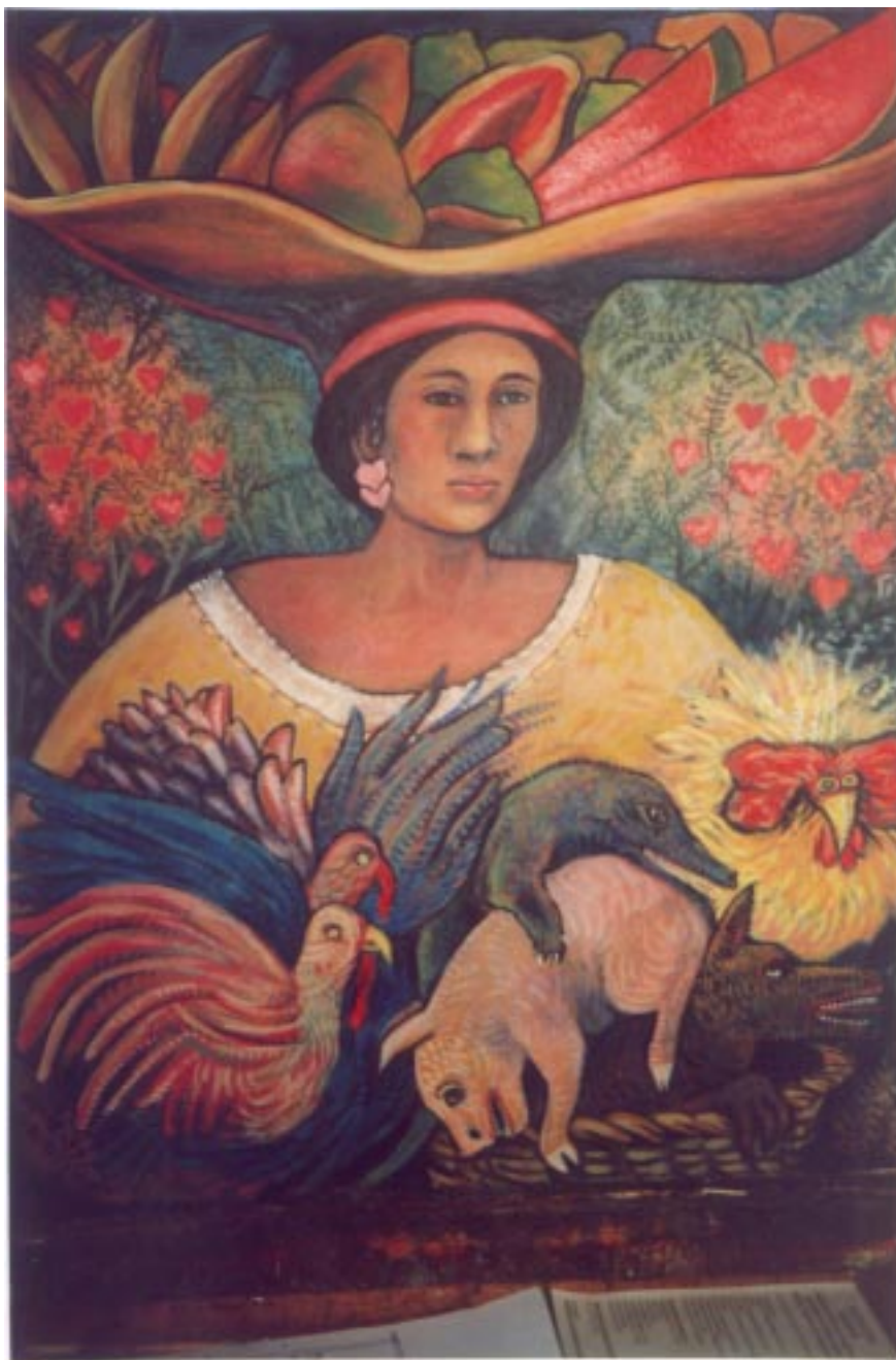
Flora con frutos. Acrílico sobre papel fabriano 70 x 50.