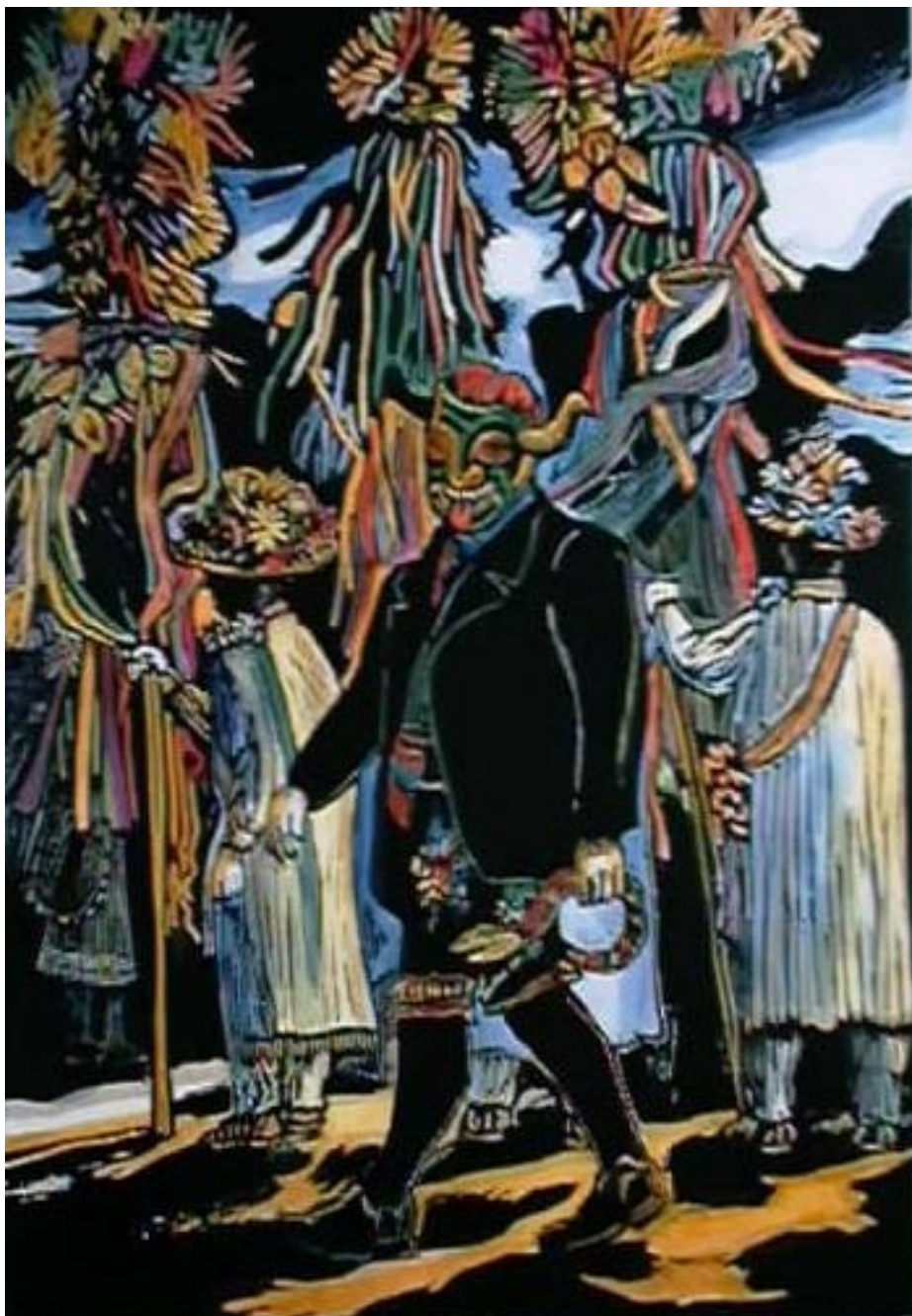
Pastores y diablo. Xilografía acquareleada 70 x 40 cm.