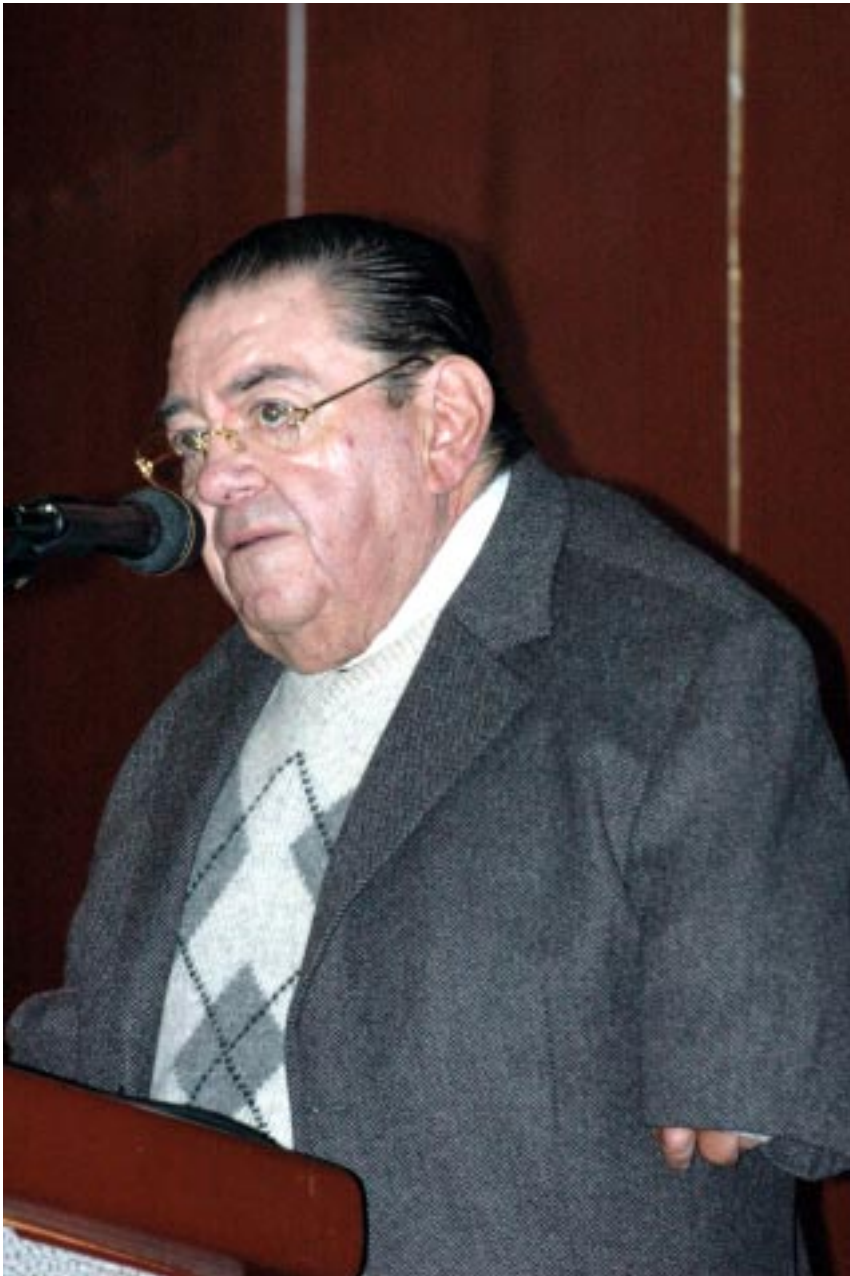
Nada de nosotros sin nosotros.