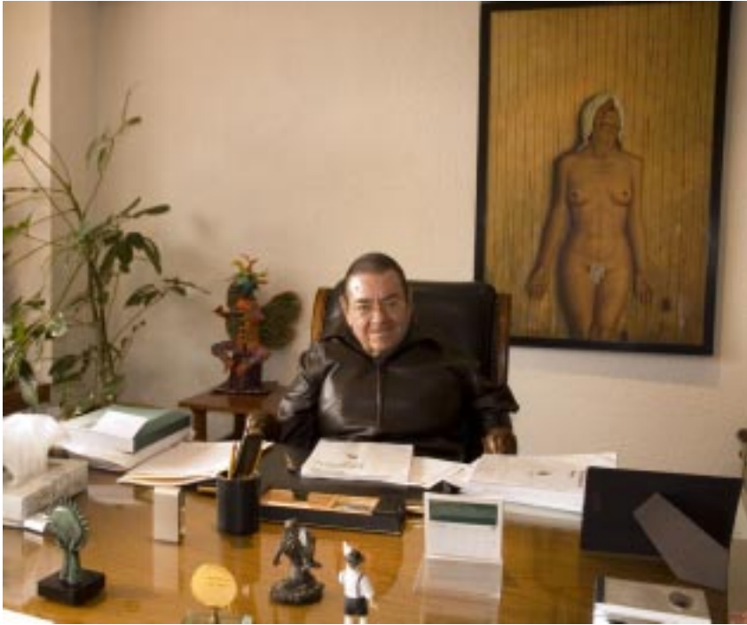
En sus oficinas de la CONAPRED.

Finalmente, se convirtió en presidente del Consejo Nacional para Prevenir la Discriminación, tribuna desde la que impulsaba cambios legislativos o realizaba recomendaciones a diversas autoridades en la lucha incansable contra todo tipo de discriminación.