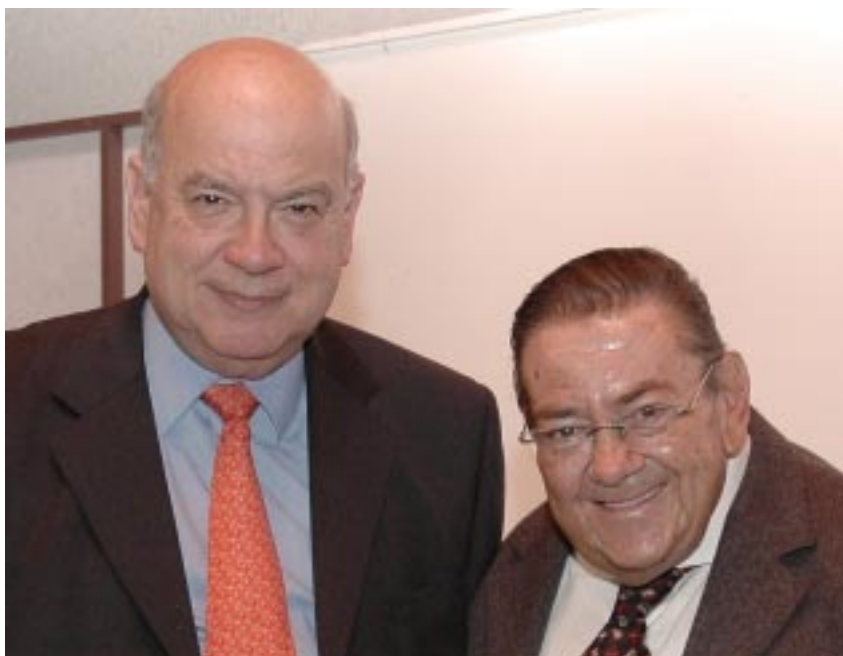
Con el Secretario General de la OEA Luis Miguel Insulza