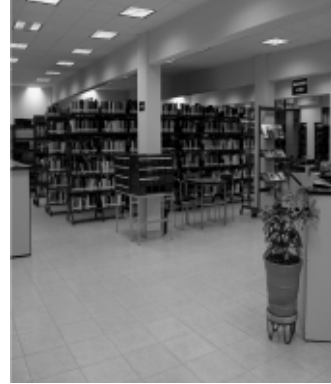
Matrícula del IMCED