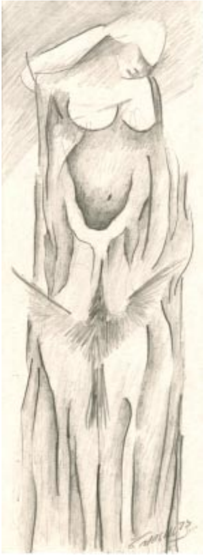
Sin título, lápiz sobre papel, 10x28 cm, de la serie hombres necios .