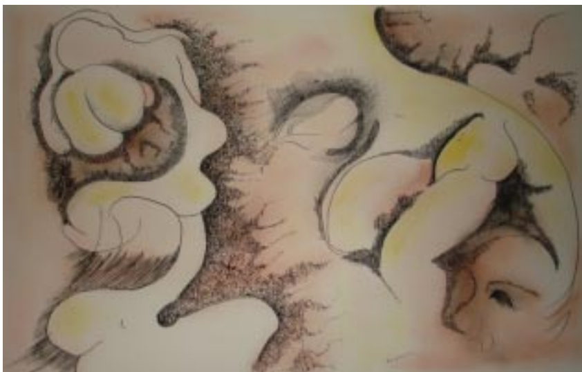
Sin título, tinta/lápiz color sobre papel, 45x29 cm, de la serie hombres necios