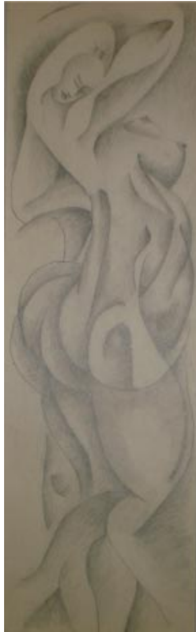
Sin título, lápiz sobre papel, 59x20 cm, de la serie hombres necios .