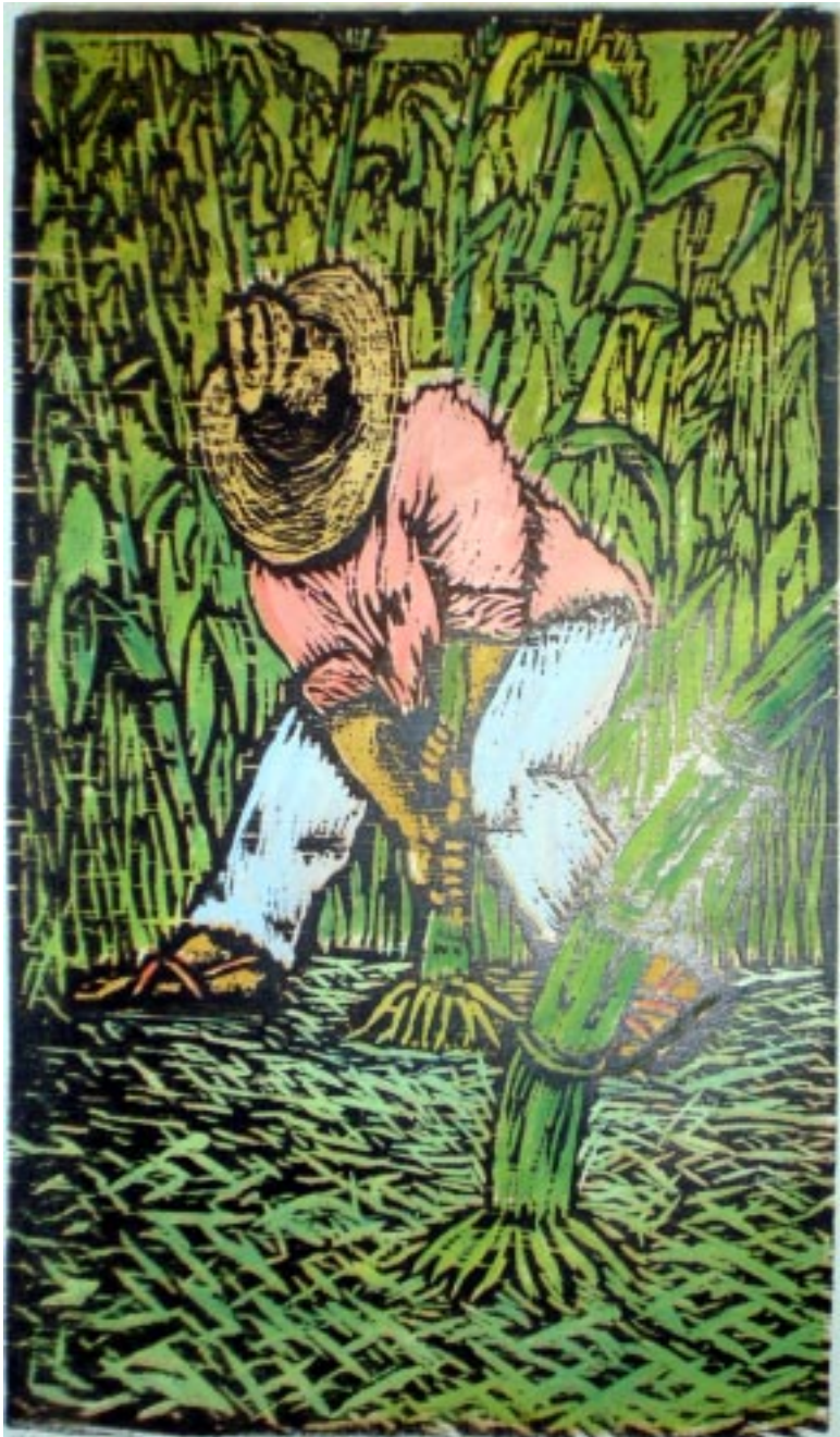
Cañero , grabado/entintado sobre papel, 46x26 cm.