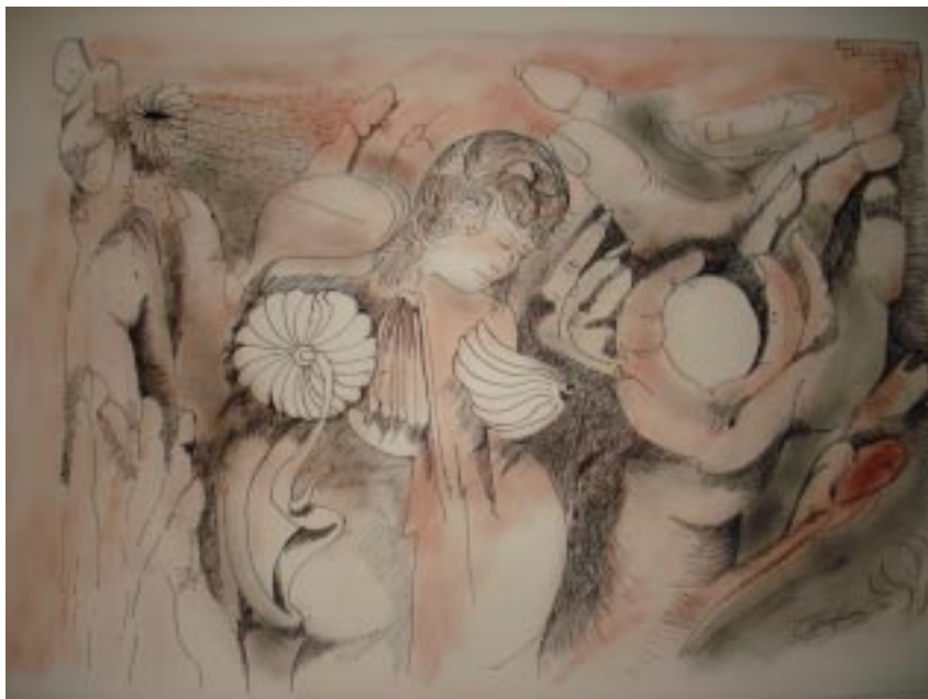
Sin título, tinta/lápiz color sobre papel, 45x29 cm, de la serie hombres necios