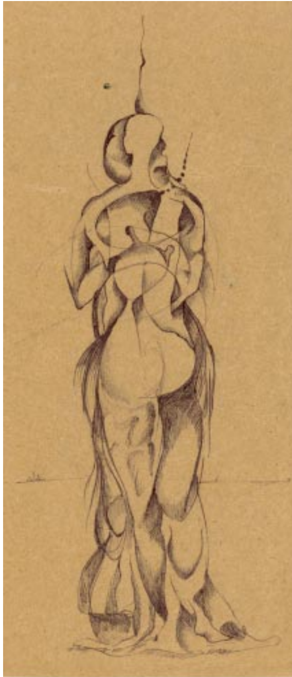
Sin título, tinta sobre papel, 25x18 cm, de la serie hombres necios .