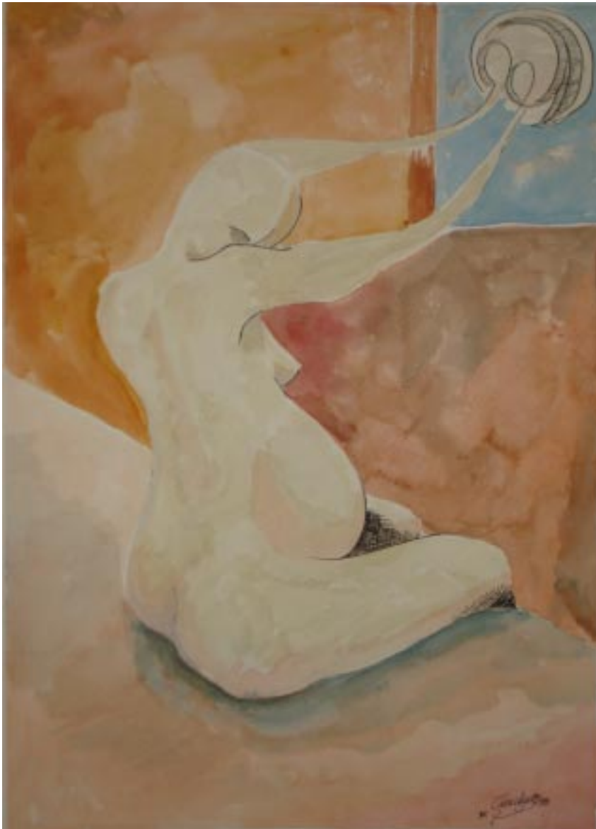
Sin título, acuarela sobre papel, 24x34 cm, de la serie hombres necios