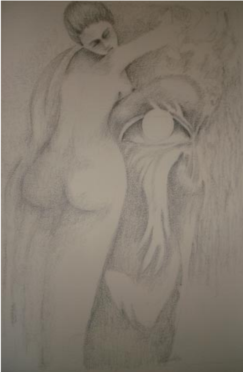
Sin título, lápiz sobre papel, 45x29 cm, de la serie hombres necios .