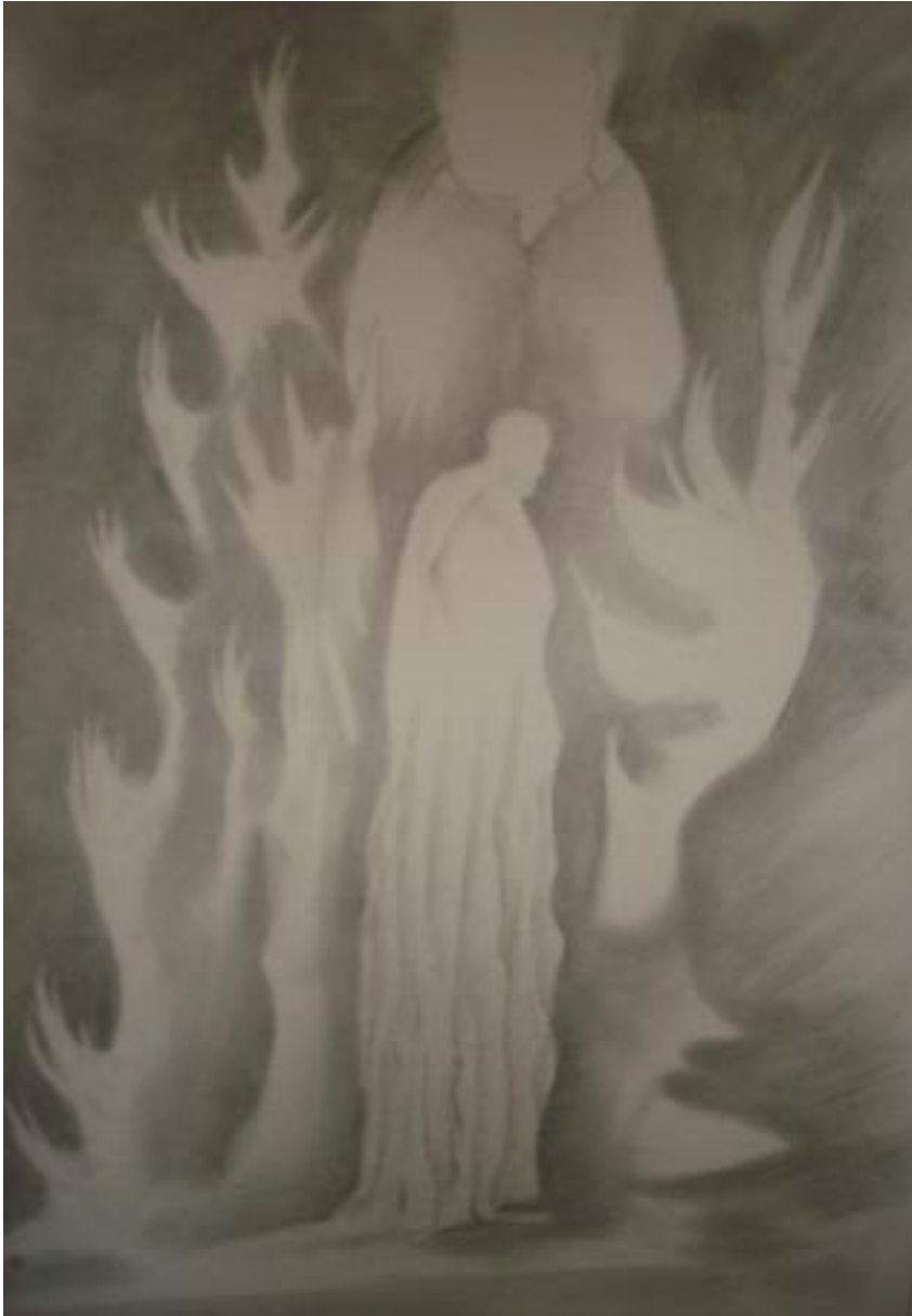
Sin título, lápiz sobre papel, 45x29 cm, de la serie hombres necios .