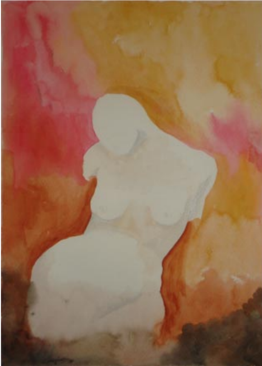
Sin título, acuarela sobre papel, 24x34 cm, de la serie hombres necios