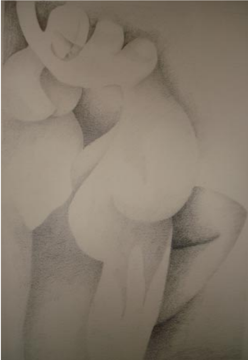
Sin título, lápiz sobre papel, 45x29 cm, de la serie hombres necios .