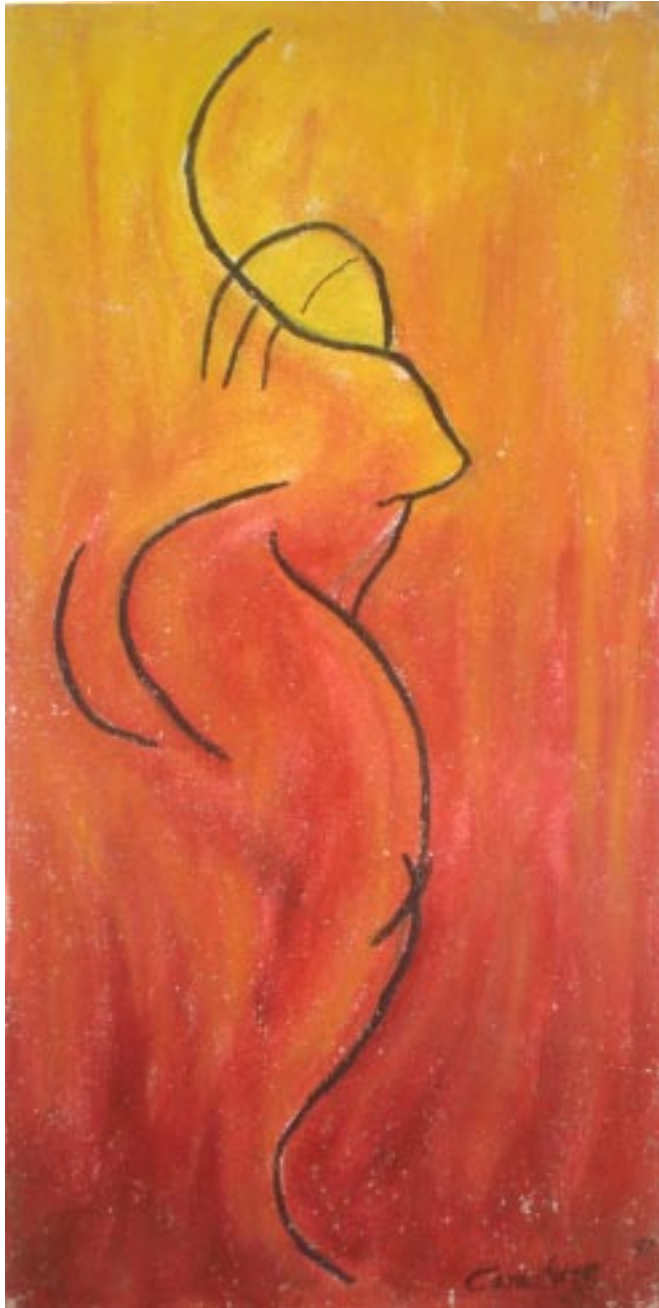
Sin título, óleo sobre madera, 58x28 cm, de la serie hombres necios .