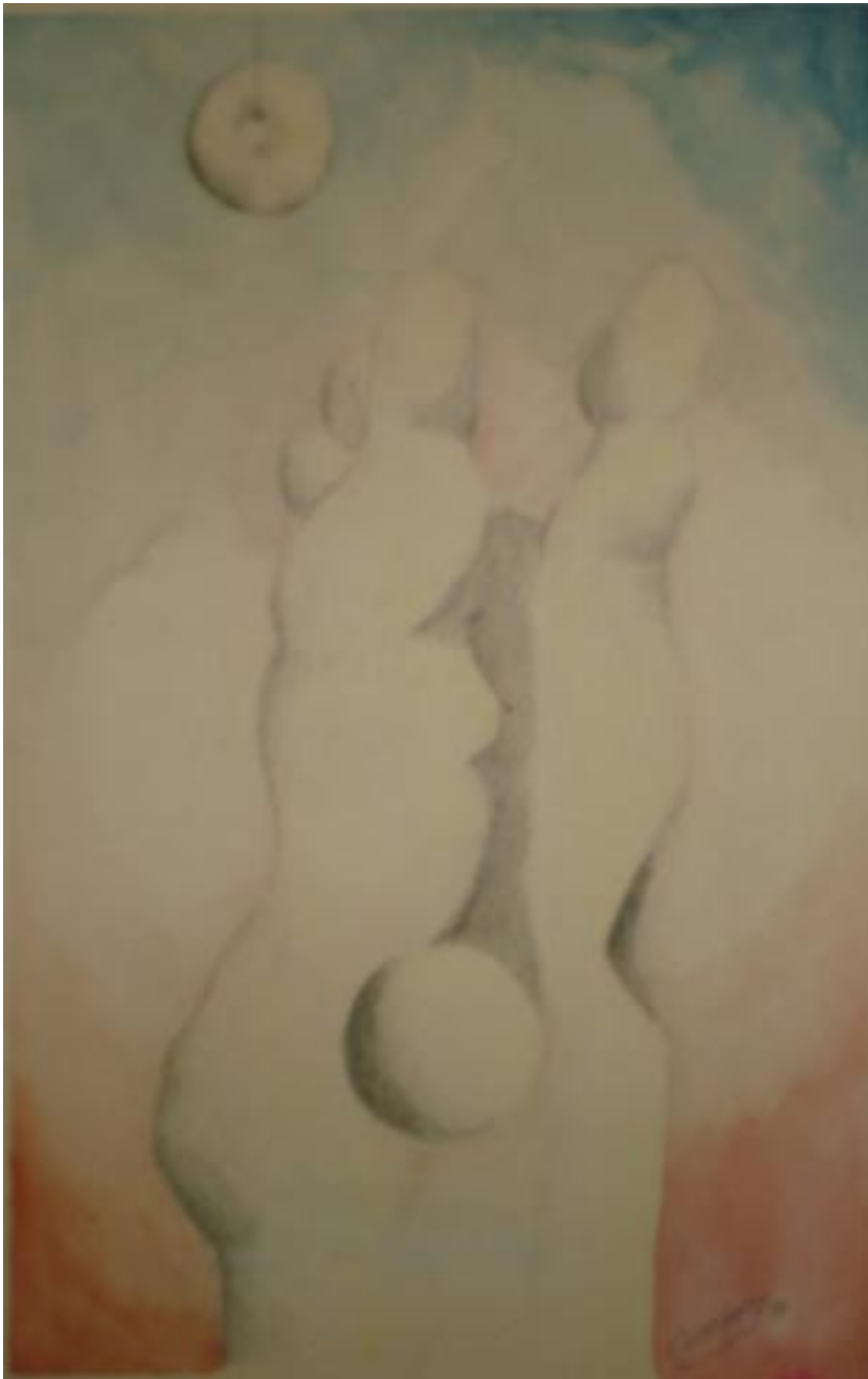
Sin título, acuarela sobre papel, 45x29 cm, de la serie hombres necios