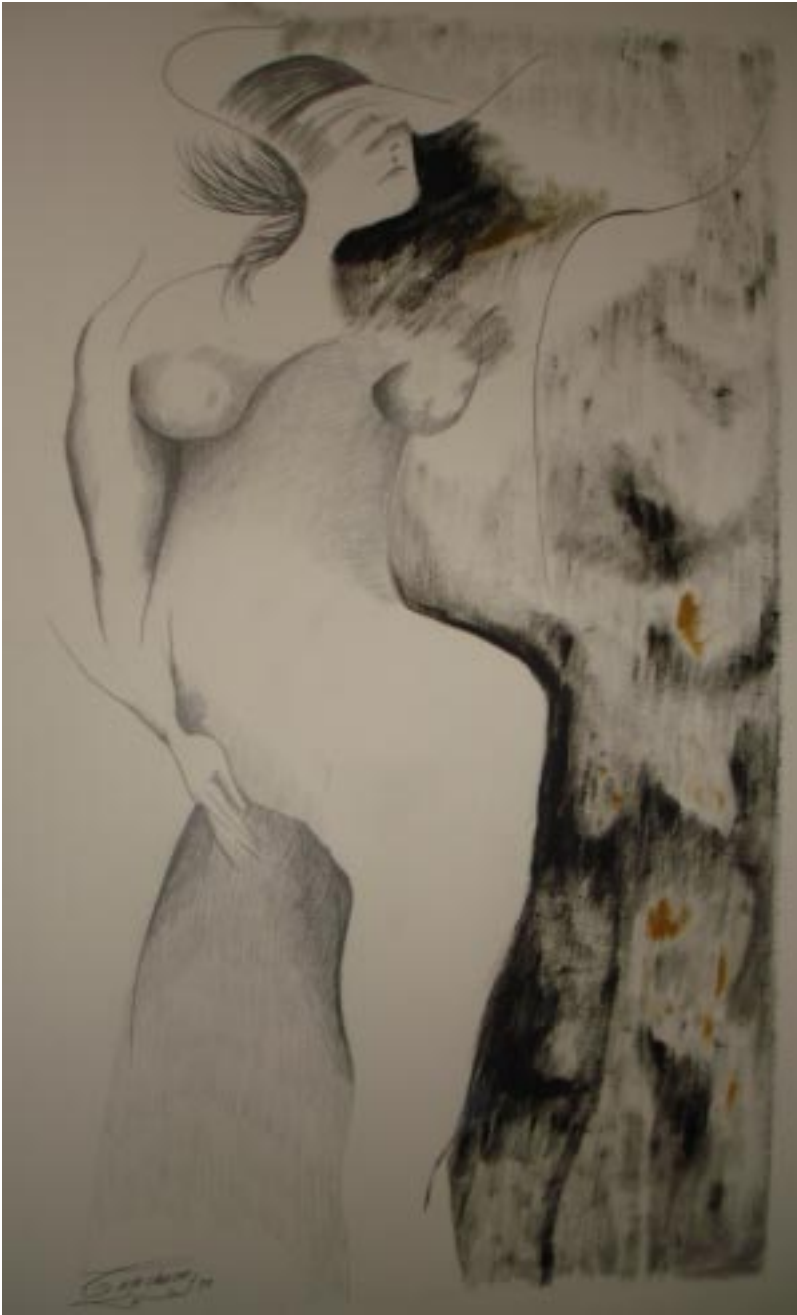
Sin título, lápiz/tinta china sobre papel, 45x29 cm, de la serie hombres necios .