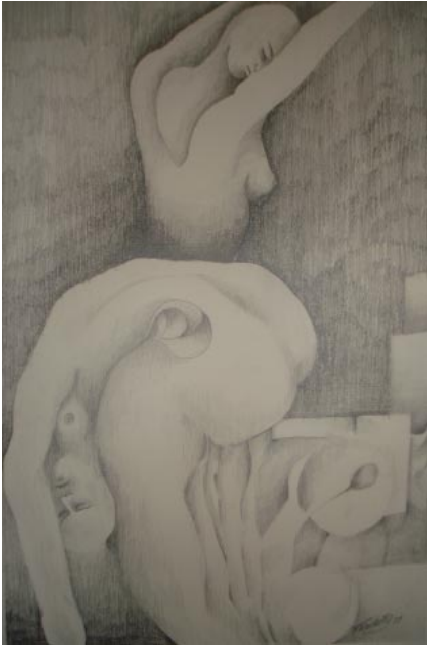
Sin título, lápiz sobre papel, 45x29 cm, de la serie hombres necios .