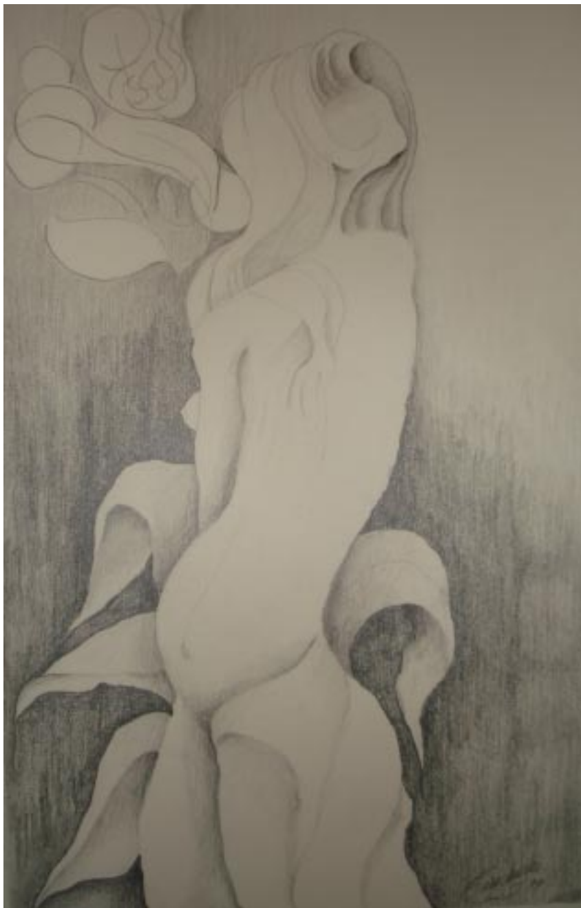
Sin título, lápiz sobre papel, 45x29 cm, de la serie hombres necios .